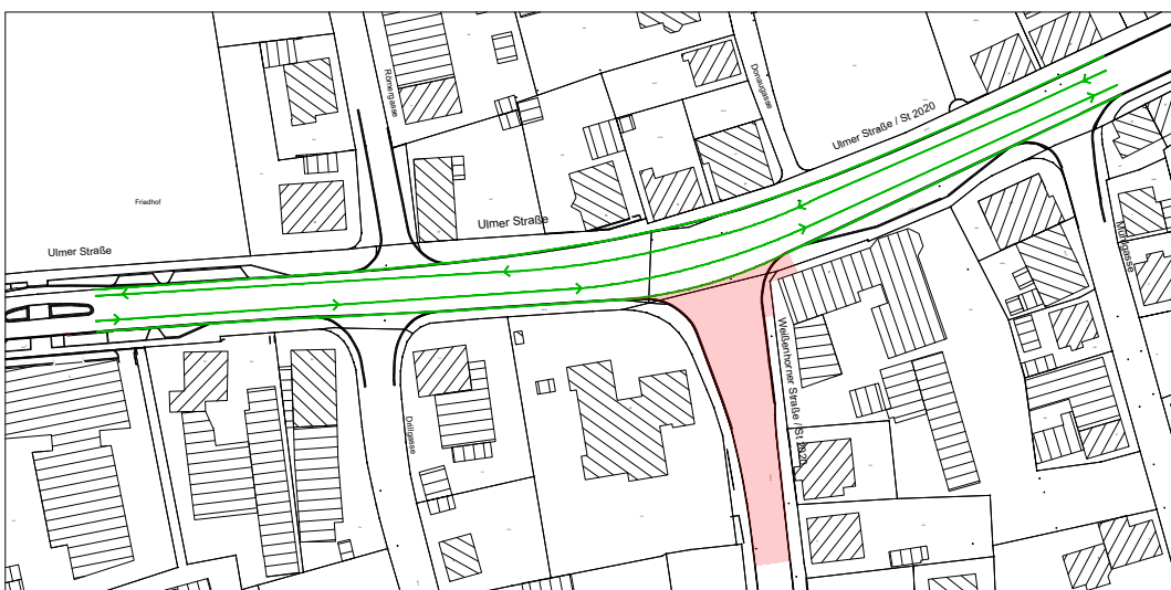
Bauabschnitt 3 08.11.21 - 17.12.21